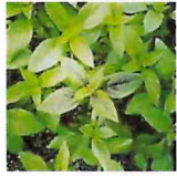
[左写真はトゥルシー（ホリーバジル）]